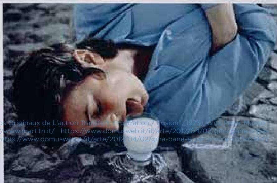
Fotografía: Deux Temps Originaux de L'action Transfert, Frustration, Fusion' (1973) Gina Pane Museo di arte moderna http://www.mart.tn.it/ https://www.domusweb.it/arte/2012/04/02/gina-pane-e-per-amore-vostro.html https://www.domusweb.it/arte/2012/04/02/gina-pane-e-per-amore-vostro.html

A partir de la revisión de las obras de Pane se crearon las categorías de clasificación: Individualismo , Sociedad anestesiada , Dolor , Represión , Protección de la Naturaleza e Infancia . La categoría Represión fue elegida como la más relevante para hacer la propuesta curatorial, debido a la gran importancia que le dio la artista a este concepto a lo largo de su carrera y la intensidad de su mensaje, haciendo alusión a distintos acontecimientos de su contexto político y social; además, se trata de un concepto que persiste en diferentes esferas de la Colombia actual, por lo cual no es difícil establecer una conexión entre ambos.