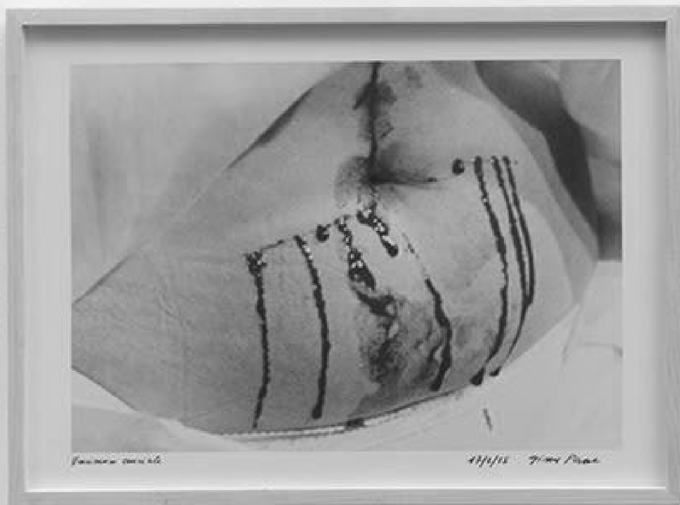
Fotografía: Psych 1974. Gina Pane. Richard Saltoun Gallery is based in Mayfair, London. https://www.richardsaltoun.com/exhibitions/72-gina-pane-action-psych/overview/