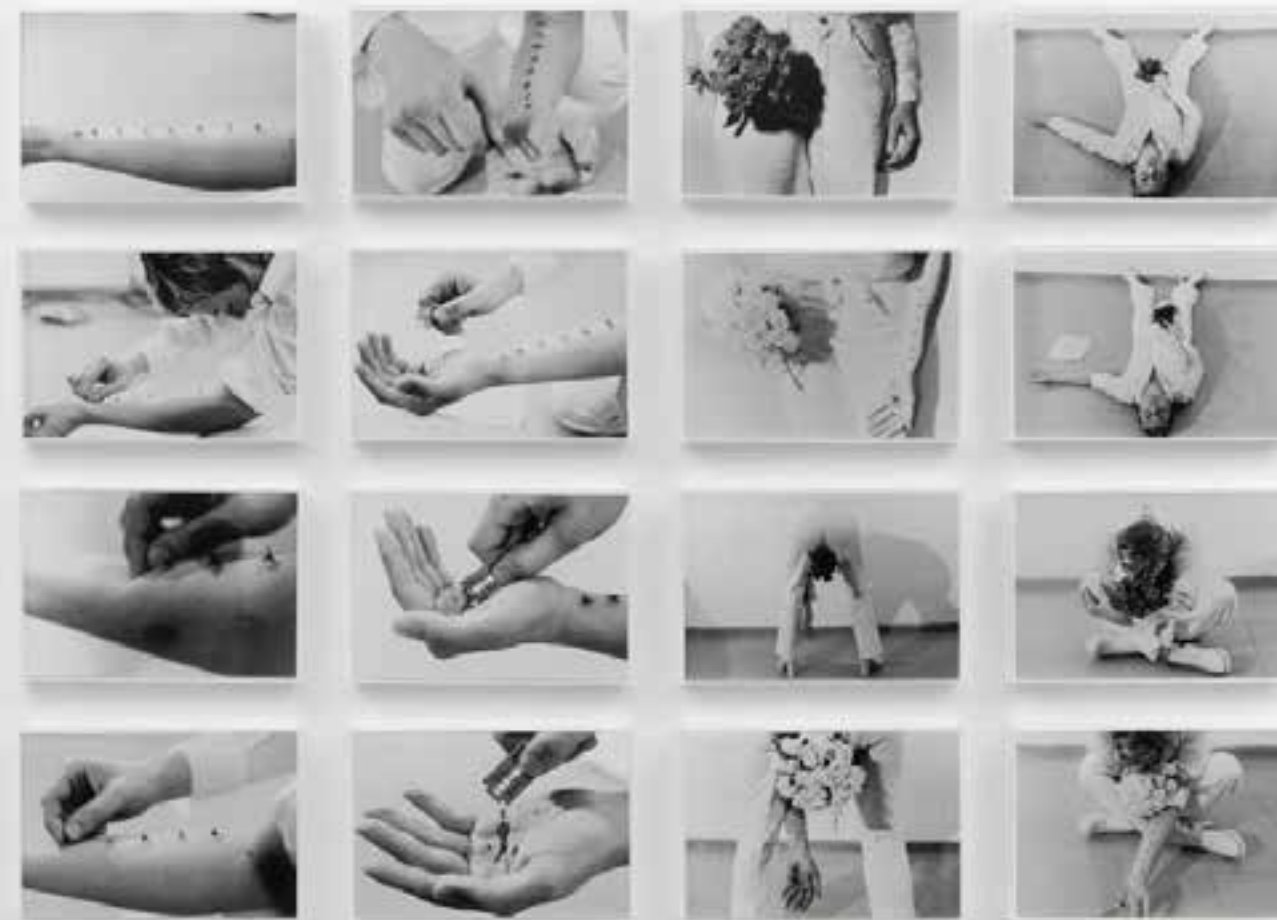
Figura 1. Psych 1974. Gina Pane. Richard Saltoun Gallery is based in Mayfair, London https://www.richardsaltoun.com/exhibitions/72-gina-pane-action-psyche/works/

Cada sala tendrá elementos de iluminación y ambientación, con el fin de lograr otros efectos en el visitante relacionados con la Represión . Las salas estarán poco iluminadas, pero de igual forma se podrán ver los alrededores del pequeño espacio. Este cambio muestra la capacidad que tenían y tienen los grupos reprimidos de ver una luz de esperanza cuando están estancados en la gran oscuridad que les impone tanto la sociedad como el gobierno. Cabe aclarar que la única luz fuerte en toda la sala, es una que ilumina la pieza de la artista y el complemento que se ubicará al lado. El espacio no permite