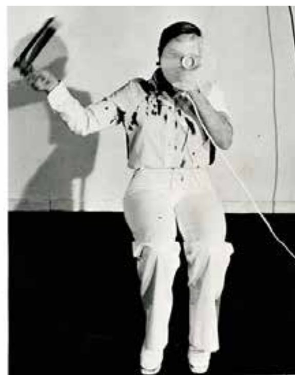
La sérénité d'Ulysse ou la métamorphose de Kafka Rassemblement original de l'action mélancolique 22.11.73 86/80 Gina Pane