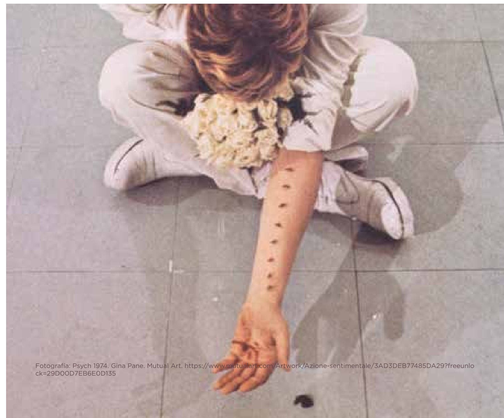
Fotografía: Psych 1974. Gina Pane. Mutual Art. https://www.mutualart.com/Artwork/Azione-sentimentale/3AD3DEB77485DA29?freeunlock=29D00D7EB6E0D135

particularmente en el contexto colombiano; a través de este ejercicio curatorial se crea un discurso en el que el trabajo artístico de Pane nos habla directamente a nosotros, los colombianos, sobre cómo nuestra sociedad continúa vulnerando derechos a través de la represión. En esta propuesta se plantea un diálogo entre las obras seleccionadas, el espacio expositivo como elemento que activa sensaciones corporales y noticias sobre hechos sucedidos en Colombia directamente relacionados con el concepto de represión desde un punto de vista político.