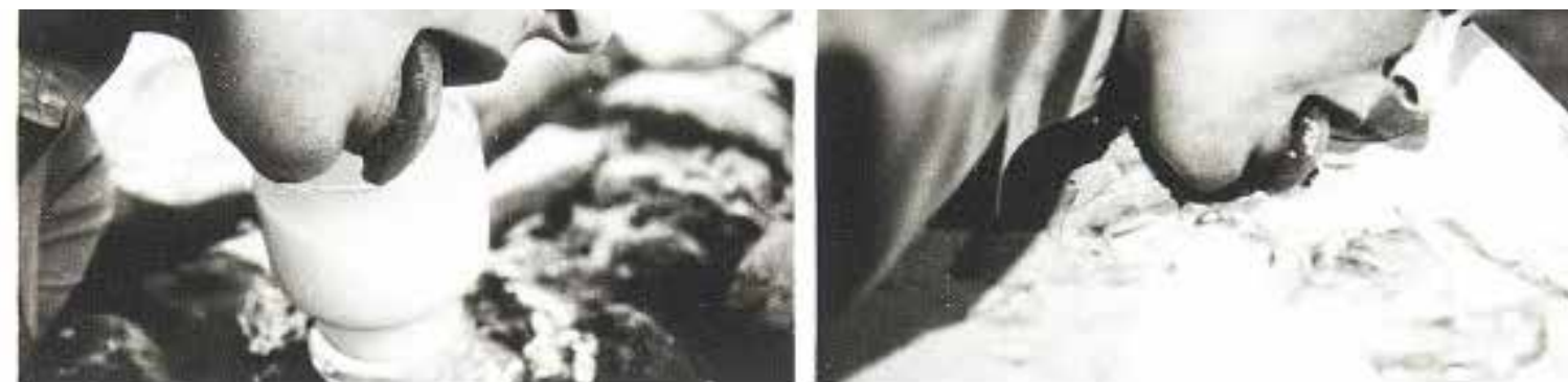
Figura 3. La sérénité d'Ulysse ou la métamorphose de Kafka” (1974). Gina Pane. Galerie Hubert Winter, Viena. https://www.artsy.net/artwork/gina-pane-la-serenite-dulyse-ou-la-metamorphose-de-kafka-document-original-de-laction-melan-colique-2x2x2-naples

deux temps originaux de l'action Transfert: Frustration / Fusion