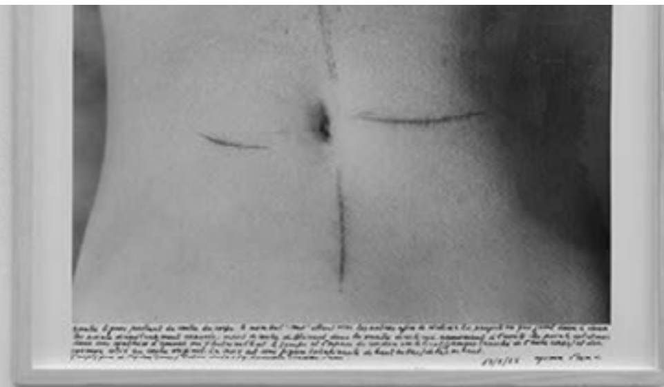
Fotografía: Psyché 1974, Gina Pane, Richard Saltoun Gallery is based in Mayfair, London. https://www.richardsaltoun.com/exhibitions/12-gina-pane-action-psych/overview/